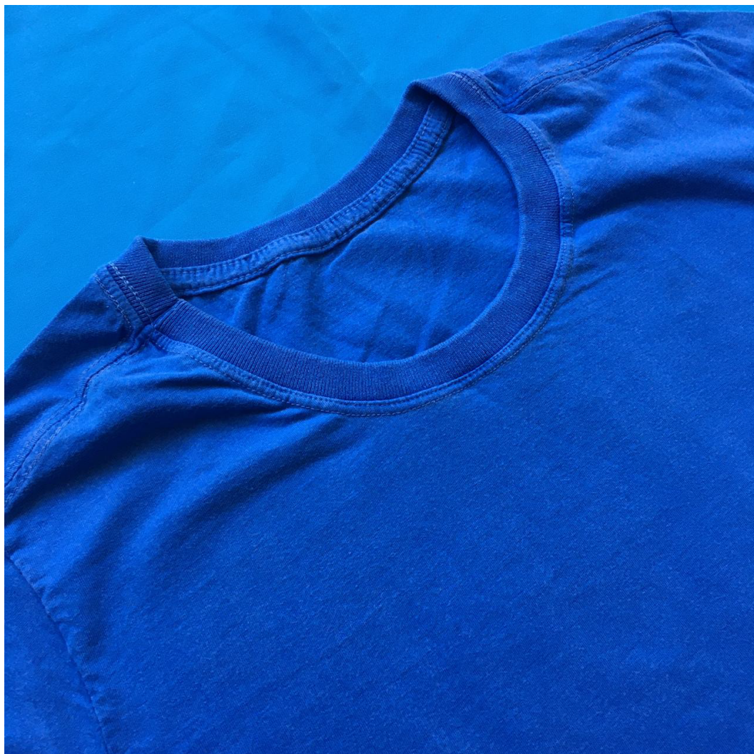
GOLA - modelo branco, tingidas e tie dye.