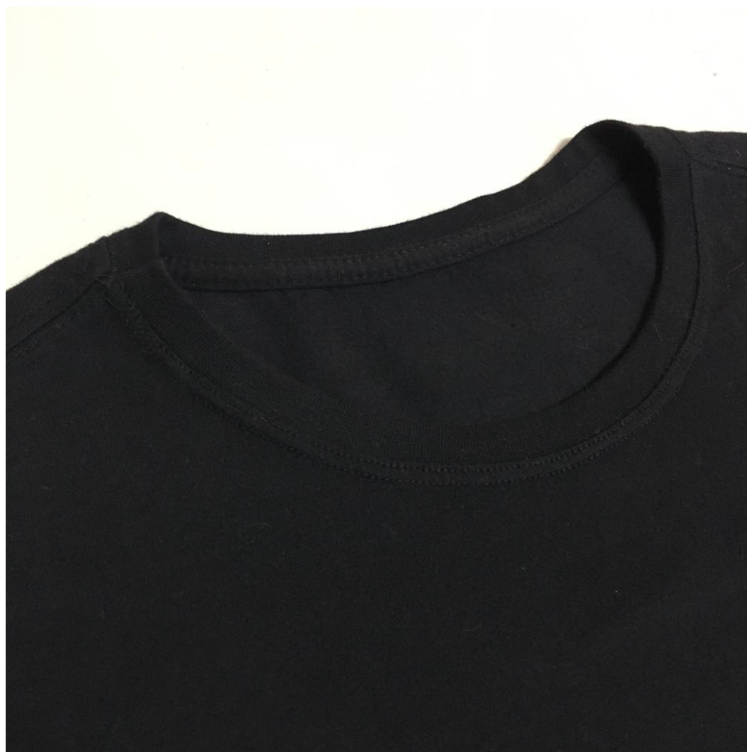
GOLA - modelo preto, e demais cores lisas.